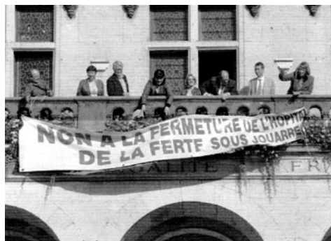
La banderole, enfin retirée du fronton de l'Hôtel de Ville !

Dans Le Fertois n° 92, de nov.–déc. 2012, vous informez les lecteurs que la banderole qui a orné pendant 2 ans le fronton de l'Hôtel de ville, dont le texte est ainsi composé :